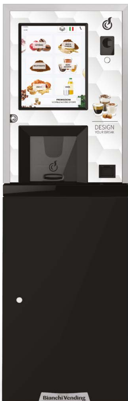
LEI250 TOUCH15" + MOBILETTO + KIT ADESIVO CON GRAFICA DESIGN YOUR BREAK IN OPZIONE