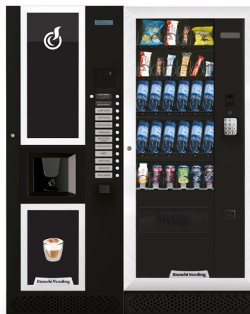
LEI400 + ARIA M MASTER

LEI400, distributore automatico per bevande calde con capacità di 400 bicchieri.